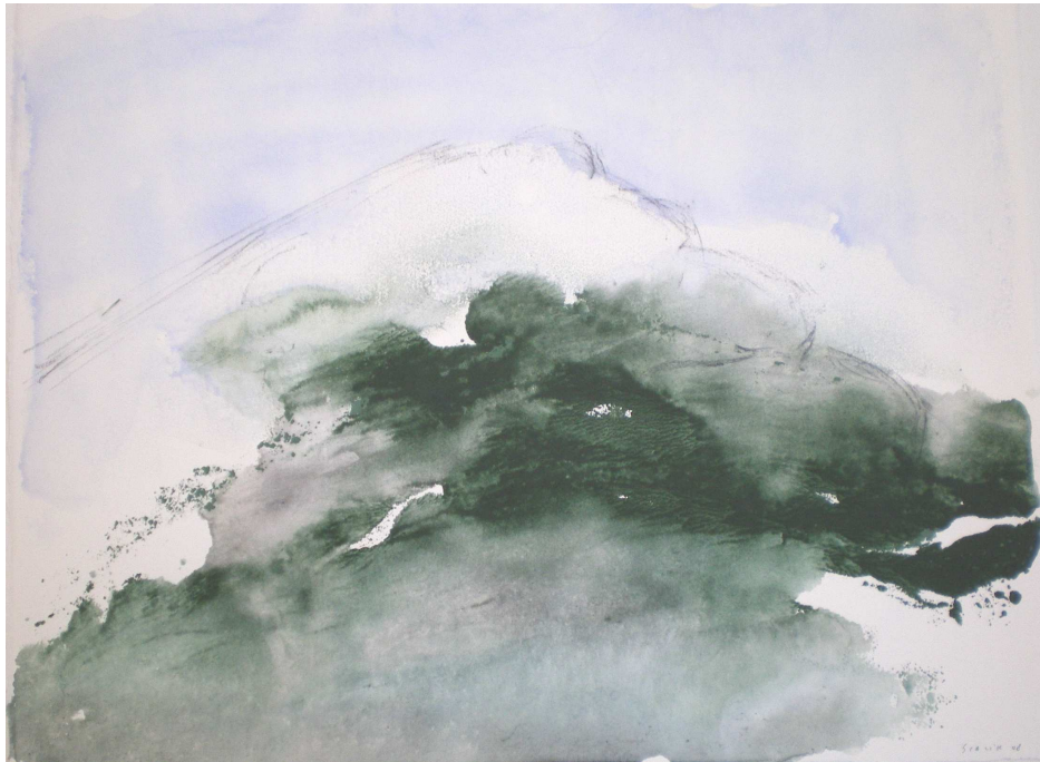
Sainte Victoire – velin d'Arches, février 2008

Depuis 2 ans, l'association Voyons Voir développe un réseau de résidences d'artistes pour la réalisation d'œuvres visuelles en milieu rural. Son action itinérante s'étend en région PACA, dans les départements des Bouches du Rhône et du Var, à l'intérieur d'un espace géographique qui englobe les trois massifs de la Sainte Baume, de la Sainte Victoire et des Monts Aurélien. L'objectif de ce réseau est de relier par l'intermédiaire des œuvres, les sites naturels, les zones d'activité agricole, le patrimoine architectural, l'environnement et les hommes.