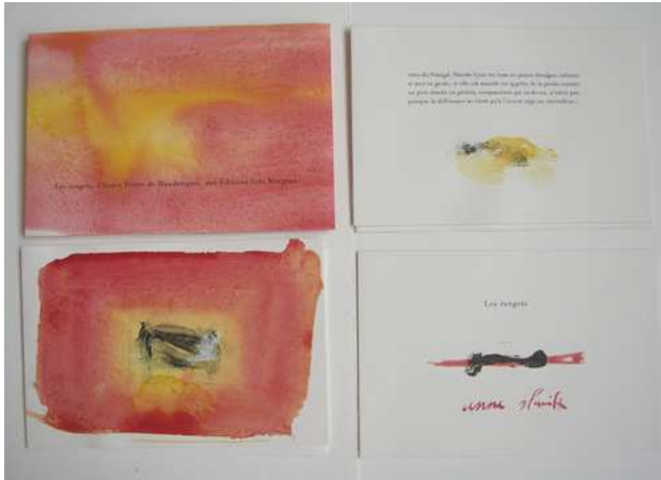
Les rougets d'André Pieyre de Mandiargues Livre peint par Anne Slacik, 5 peintures originales, 30 ex., édition Fata Morgana, 2002

Quel apport représentent les mots dans votre travail ?