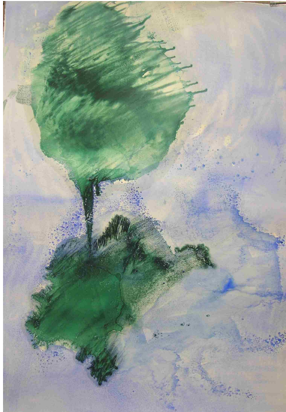
Arbres - mixte sur Velin d'Arches 120x80 cm, 2006